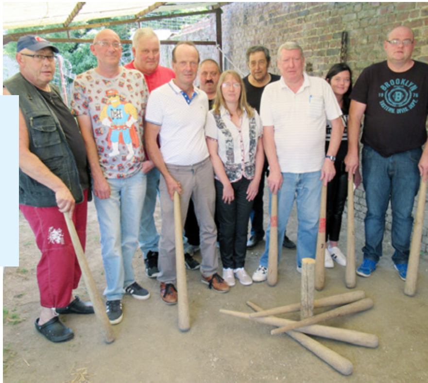
Les membres des billonneux du 112 entendent perpétuer la belle tradition du jeu de billon.

L'association compte 50 membres. Elle se réunit le dimanche matin au café de l'étoile