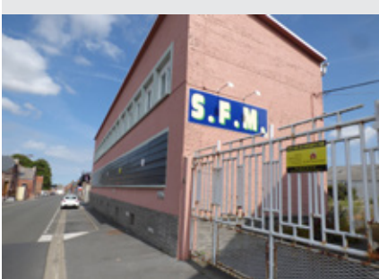
La friche SFM, à deux pas du centre ville va être détruite.

La ville entreprend d'importants chantiers dans la commune. Démolition de friches, travaux dans les écoles, création de parking... La ville mise sur l'avenir.