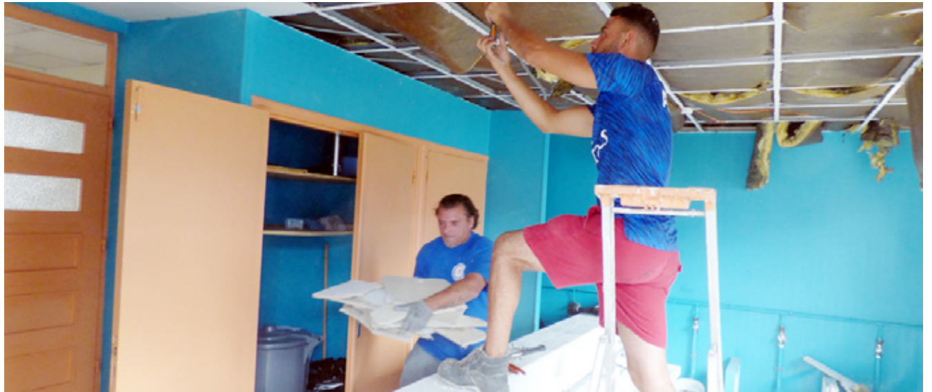
Pendant l'été, des travaux sont entrepris dans les toilettes de l'école Casanova.

Parmi les nombreux chantiers, la ville souhaite redonner vie à deux friches.