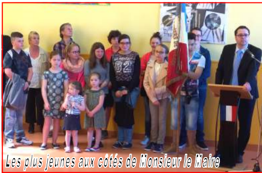
Les plus jeunes aux côtés de Monsieur le Maire

Le 8 mai 2016, lors de la commémoration des 71 ans de l'armistice de 1945, la cérémonie fut dédiée à la mémoire de ceux qui ont laissé leur vie pour la liberté et la paix.