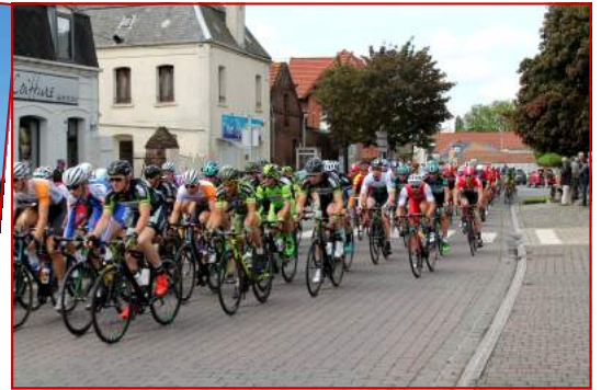
Cette photographie du Paris-Arras a été aimablement transmise par M. César Herbin. Nous le remercions.

Depuis plusieurs années, l'Association des Parents d'Élèves s'est attelée à équiper les écoles de matériel moderne et en phase avec notre temps. Le TBI (tableau blanc interactif) est un écran blanc tactile connecté à un ordinateur et à un vidéoprojecteur. L'ordinateur envoie ce que l'on voit sur son écran au vidéoprojecteur qui l'affiche sur l'écran blanc tactile (le tableau). Celui-ci recueille et interprète les actions des utilisateurs et les renvoie à l'ordinateur. Aujourd'hui, toutes les classes de l'école élémentaire sont équipées de TBI pour un montant investi par l'association de 7620 €. Un plus indéniable pour les élèves et l'on peut saluer et remercier l'investissement de l'association.