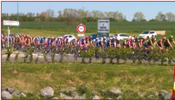
Le mois de mai avesnois a été marqué notamment par le passage de grandes courses cyclistes professionnelles : les 4 Jours de Dunkerque, Paris-Arras et Paris Roubaix Espoirs.