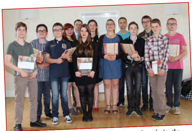
Réception en Mairie des collégiens, lauréats du Concours National de la Résistance et de la Déportation. Une fierté !