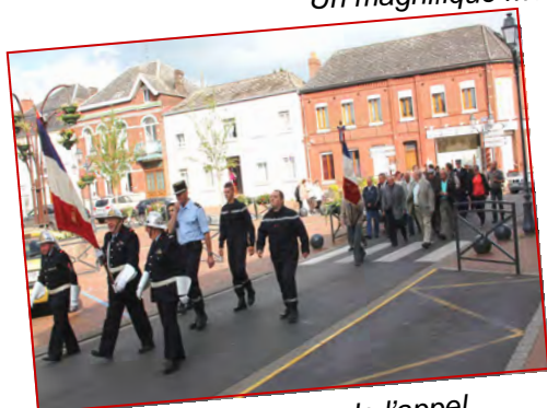
Commémoration de l'appel du 18 Juin 1940.