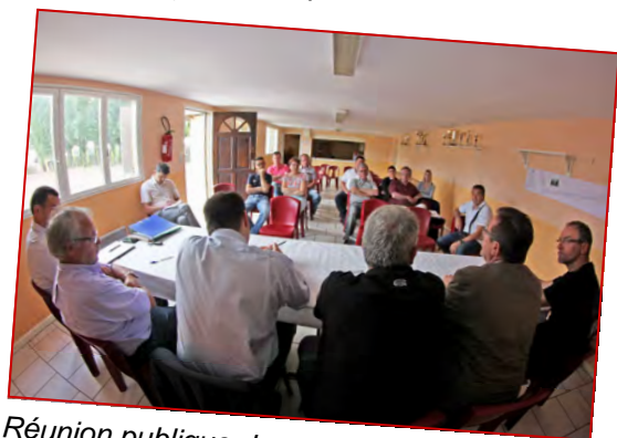
Réunion publique des riverains sur les travaux (3 ème tranche) de la rue Henri Barbusse.