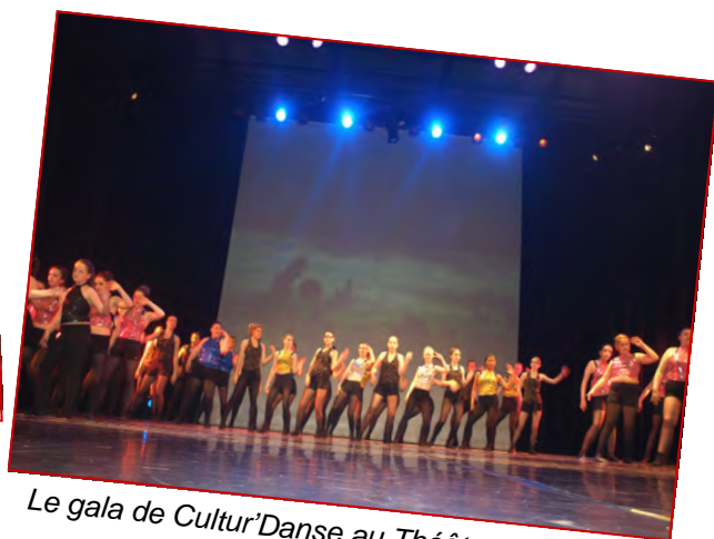
Le gala de Cultur'Danse au Théâtre de Caudry.