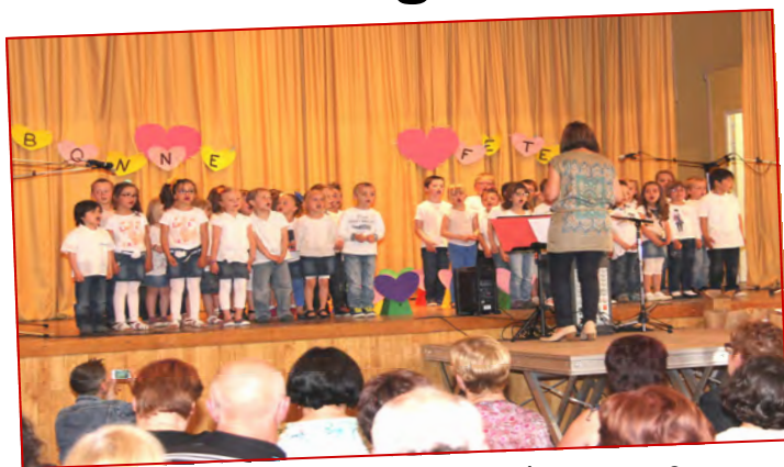
Une vive émotion pour la fête des mamans. Un magnifique moment !