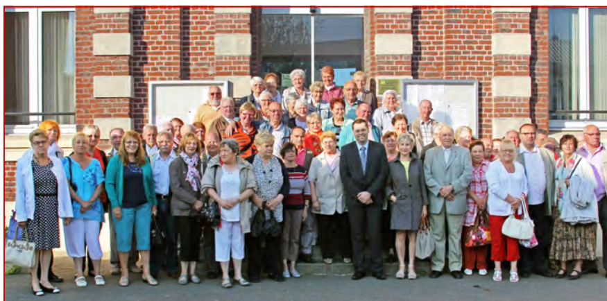
Le voyage des aînés : le départ pour une belle journée...