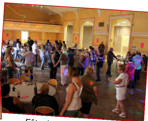
Fête de la musique 2014. Quelle ambiance...