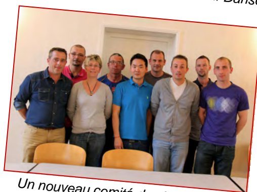
Un nouveau comité des jeunes pour l'Olympique Club Avesnois.