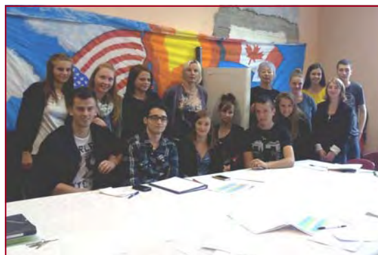
L'équipe d'animation prépare l'Accueil de Loisirs de Juillet.