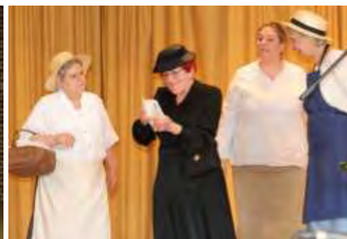
Le vernissage de l'exposition du 14 avril dernier avec l'intervention de M me Urbanick de la Ligue des droits de l'Homme et des saynètes très réalistes jouées par Les Amis du Château et du Terroir d'Esnes et la troupe « Pourquoi pas » de Cagnoncles.