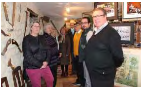
Les 24 et 25 mars derniers, une belle exposition de photographies a été organisée à la Maison du Patrimoine par l'association Arts et Culture, Loisirs pour tous !