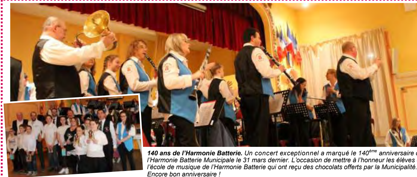
140 ans de l'Harmonie Batterie. Un concert exceptionnel a marqué le 140 ème anniversaire de l'Harmonie Batterie Municipale le 31 mars dernier. L'occasion de mettre à l'honneur les élèves de l'école de musique de l'Harmonie Batterie qui ont reçu des chocolats offerts par la Municipalité. Encore bon anniversaire !