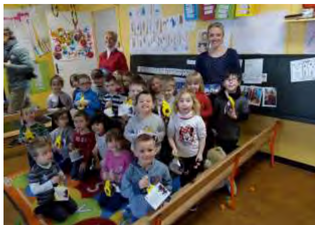
Comme l'Association des Parents d'Élèves, la Municipalité a offert des chocolats de Pâques aux élèves de l'école maternelle Danielle Casanova.