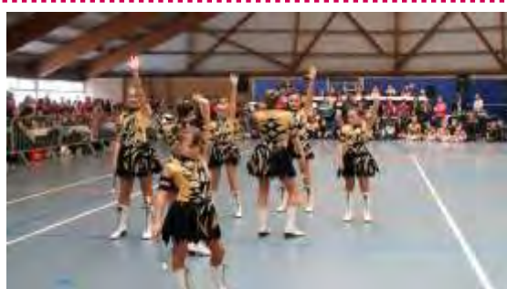
Les majorettes avesnoises ont organisé, le samedi 31 mars, la 29 ème édition de leur festival de majorettes à la halle des sports du collège Paul Langevin. Un spectacle toujours magnifique, coloré et rythmé !