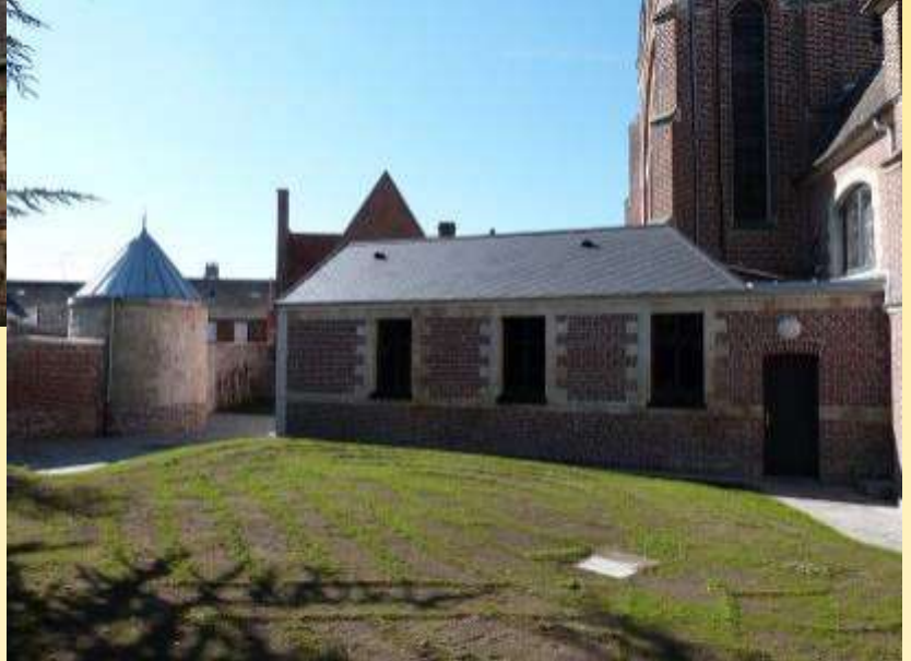
Aujourd'hui, la sacristie réhabilitée et la tourelle, plus ancien bâtiment de la ville, mises en valeur.

Huit mois ont été nécessaires pour ces travaux, qui étaient plus qu'indispensables au vu de l'état particulièrement dégradé de la sacristie.