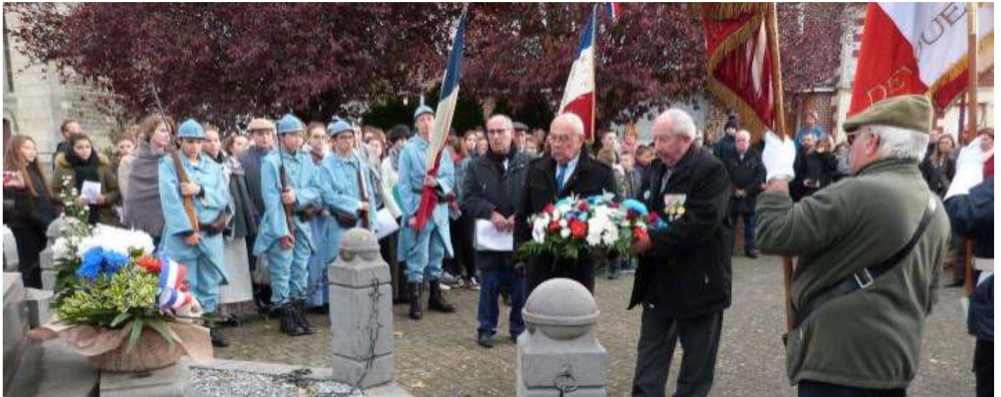
Défilé, dépôt de gerbes et minute de silence au monument aux morts, pour saluer la mémoire des civils et militaires fauchés si violemment lors de ce terrible conflit.

Nombreuses étaient les personnes réunies le 11 novembre dernier pour commémorer le 100 ème anniversaire de la fin de la Première Guerre mondiale. En cette période troublée par de trop nombreux conflits sur notre planète, il est essentiel de perpétuer le souvenir, de commémorer la victoire, mais surtout de célébrer la paix. Retour en images.