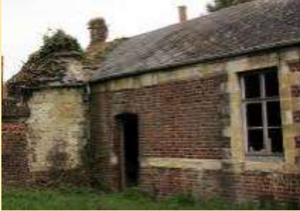
Hier, le bâtiment dans un état particulièrement vétuste.

Les travaux, qui étaient évidemment budgétés, se sont élevés à environ 400 000 €, subventionnés à hauteur de 150 000 € par le Conseil Départemental du Nord au titre de l'Aide aux Villages et Bourgs.