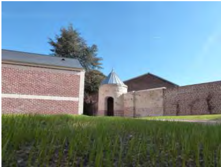
Les travaux de réfection de la sacristie et de la tourelle sont terminés.